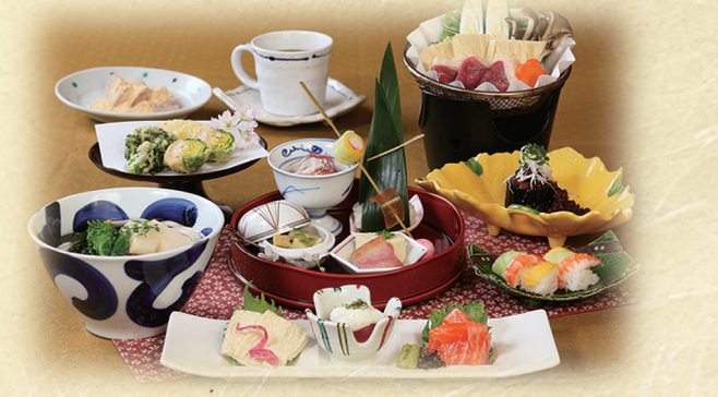
写真は「お昼の特別懐石料理」です。

お一人様 1,980円 (税別) ●一の膳 (活うどん造り) ●二の膳 (季節の吹寄せ色々) ●三の膳 (二種造り) ●鴨のロースト ●季節ご飯 ●天ぷら ●おうどん ●デザート